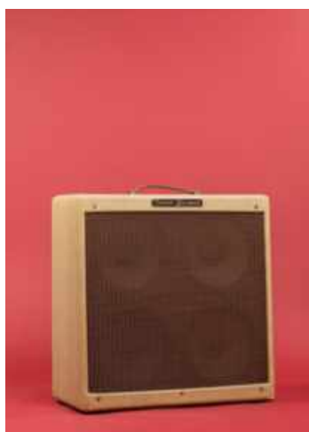
Ampli guitare Fender Bassman Tweed. Numéro de série FH 3M01071. Année : 1956

Un second volet est consacré aux memorabilia, objets souvenirs rattachés à l'histoire d'un artiste, avec la vente d'une série de patrons du tailleur Tom Baker pour Johnny Hallyday, Mick Jagger ou de Robert Plant pour son dernier concert avec Led Zeppelin en 2007. Dans un autre registre, plusieurs séries de lithographies sont mises en vente, comme par exemple deux très belles lithographies signées par Storm du Dark Side of the Moon.