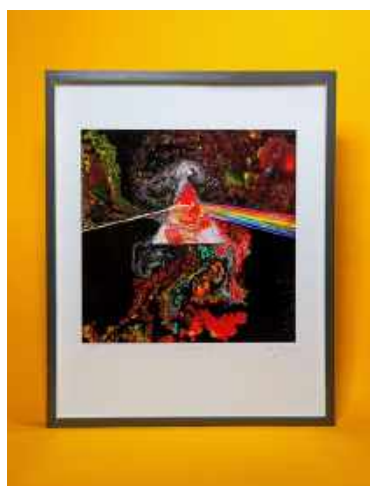
Liquid Dark Side of The Moon B2. Sérigraphie fine Art - Test - Signé Storm Thorgerson