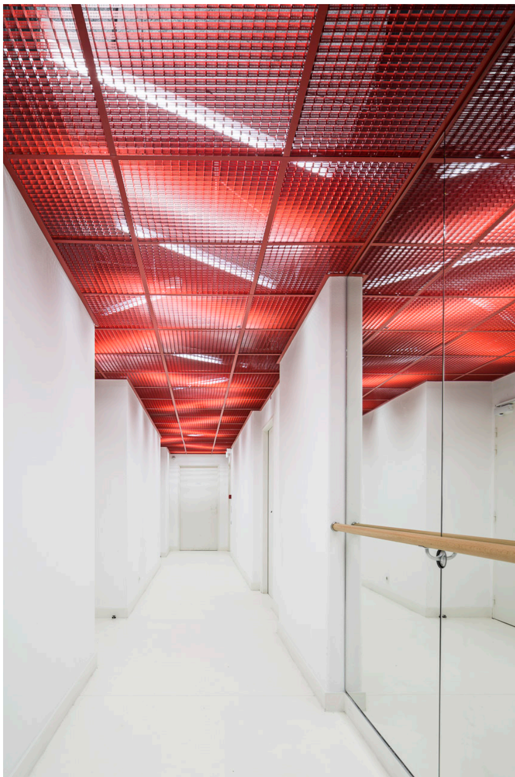
Clarté du couloir des loges qui répond à la profondeur obscure de l'arrière-scène.