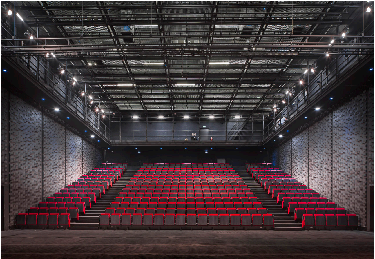
La salle Gémier (400 places), ouverte à toutes formes de scénographies contemporaines, est un espace totalement modulable.